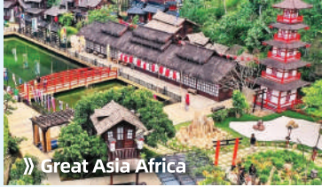
➔ Great Asia Africa