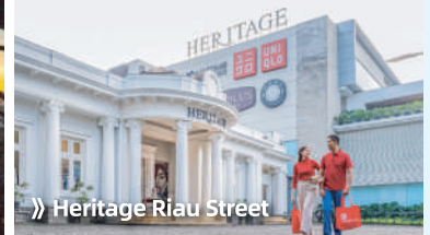
» Heritage Riau Street