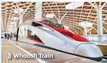
➔ Whoosh Train