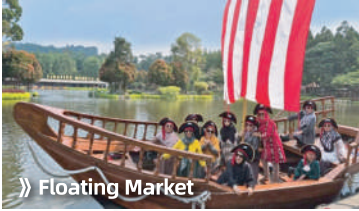
➔ Floating Market