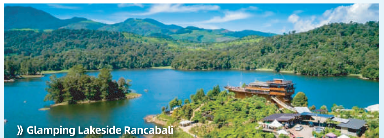
» Glamping Lakeside Rancabali