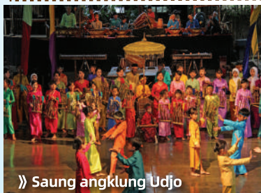
» Saung angklung Udjo