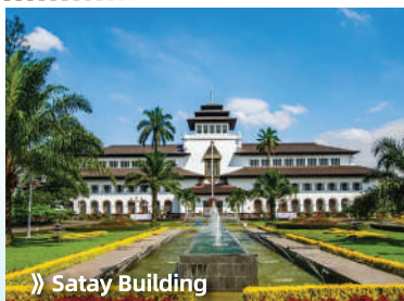
» Satay Building